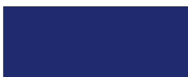
344 Blu scuro