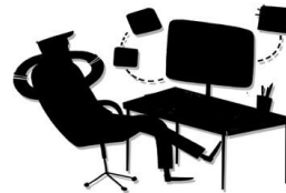
Immagine da stampare

Creare un duplicato con solo colore nero 100%