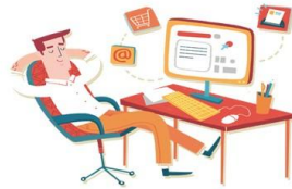
Immagine da stampare